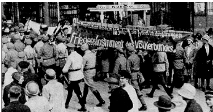
Abb. 5 Daß Demonstrationen unter Einbeziehung eines Sarges keine Seltenheit waren, zeigt das obige Foto, das ebenfalls anlässlich einer Agitation gegen den Panzerkreuzerbau im Herbst 1928 vor dem Karl Liebknecht-Haus in Berlin aufgenommen wurde. (Aus: Ernst Thälmann, Dokumente ..., Berlin 1988)

Bei der Antikriegskundgebung am 4. August 1928 versuchte Taube die SPD mit einem historischen Vergleich zu diskreditieren. So habe jene Partei, die am Weltkrieg schuld gewesen sei, es abgelehnt mitzudemonstrieren, und somit marschiere „als einzige Arbeiterpartei die KPD gegen den Krieg“. 353 Von einem Tisch herunter führte Taube eine „wuchtige Demonstration“ als Beweis für den Willen der Arbeiter an, daß sie keinen Krieg mehr wollten. 354 Das sei nötig, da Polen „Kriegsvorbereitungen gegen Litauen“ treffe, und es bald „auch gegen Rußland losgehen“ werde. 355 Beim anschließenden Fackelzug von „gut 1000 Personen“ mit 18 Fahnen forderten die Demonstranten auf 17